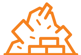
6 Fraction minérale (gravats)