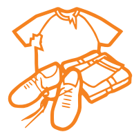
9 Textiles (au 1 er janvier 2025)