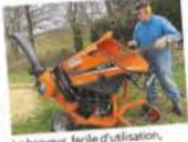
Le broyeur, facile d'utilisation, sur un chantier récent.